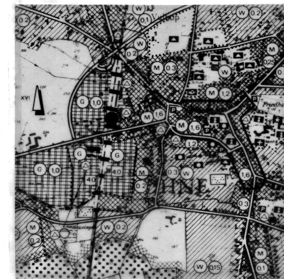
AUSSCHNITT AUS DEM FLÄCHENNUTZUNGSPLAN DER STADT LOHNE